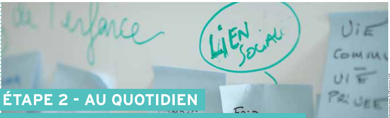
Veritissage à l'Espace LVI