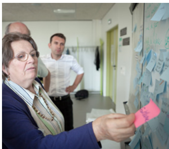
Workshop Seniors - Mardi 16 septembre

« Comment faciliter l'implication des seniors dans la vie de quartier ? »