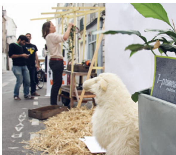
Park(ing) Day - Vendredi 19 septembre

L'imaginaire prend place quartier des Olivettes