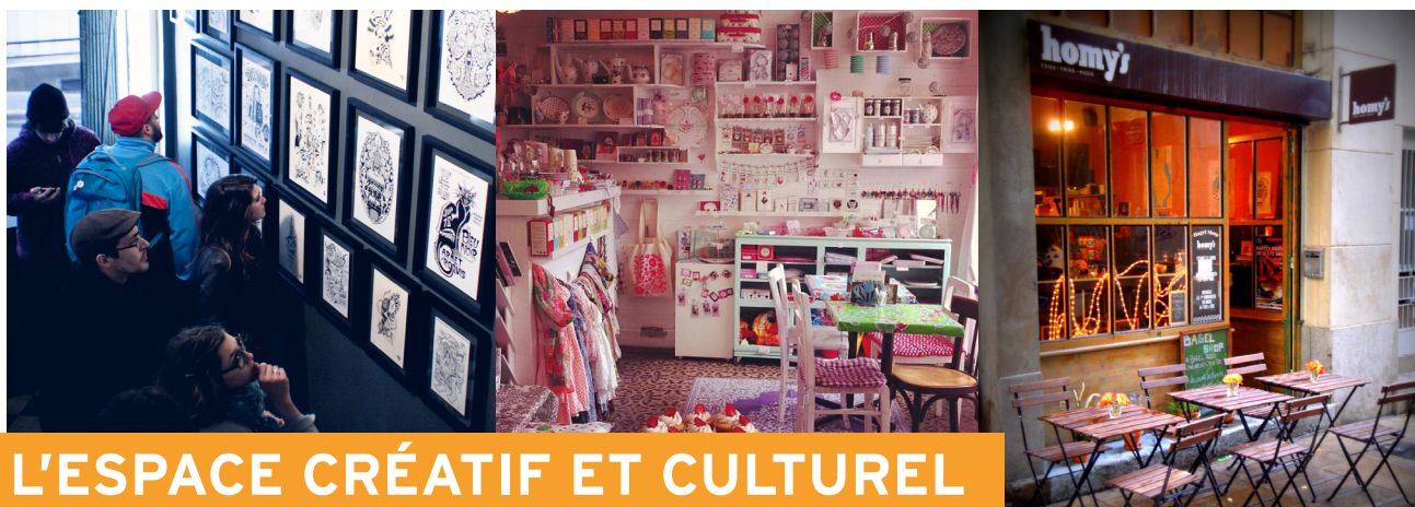
De gauche à droite : Espace LVL, Henry & Henriette et Homy's