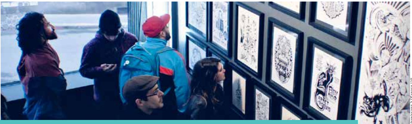
Vernissage à l'Espace LVI