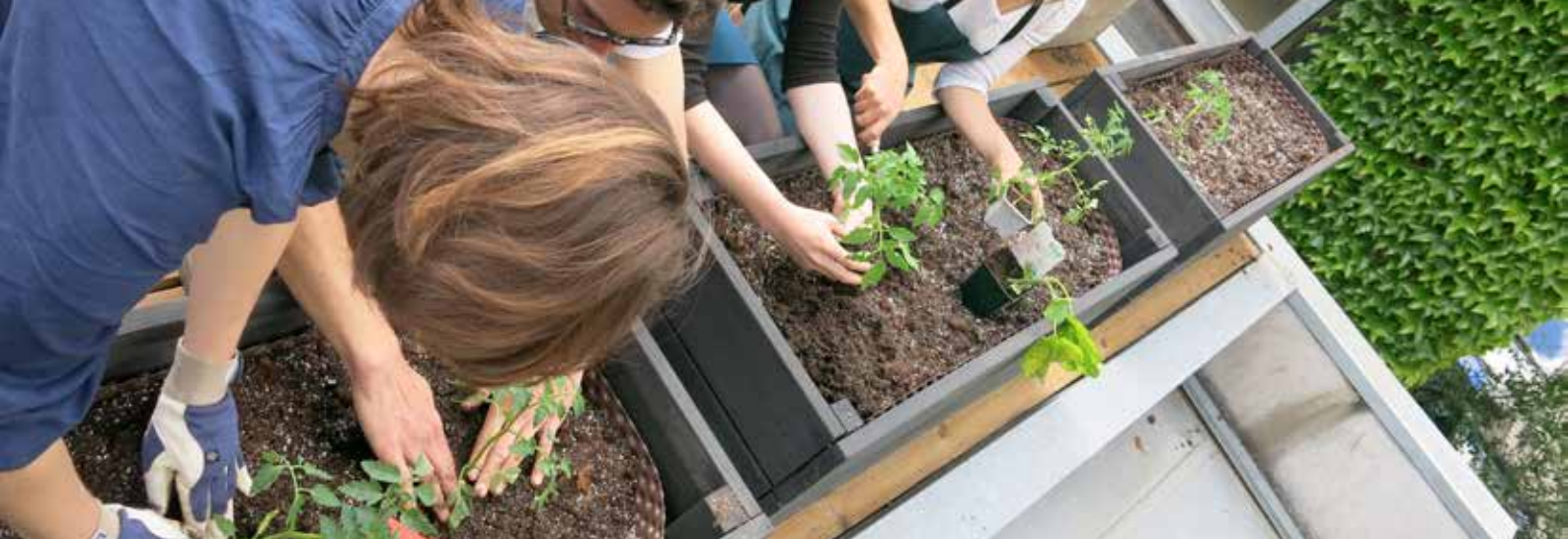
Préfiguration des jardins partagés à La Terrasse (mai 2014)