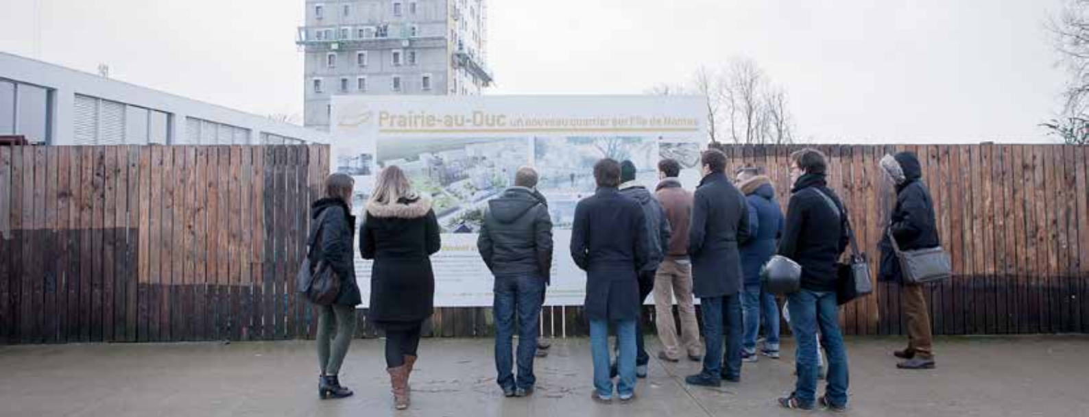
Visite sur le futur site du projet îlink - Janvier 2014