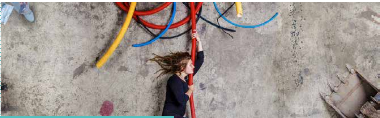
Le chantier du Point Haut